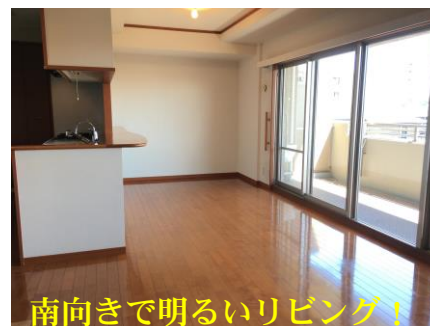
南向きで明るいリビング！