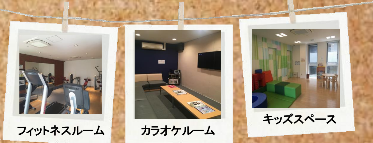
フィットネスルーム